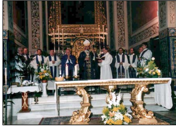
Momento de la misa de la bendición.