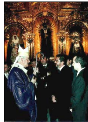
El Cardenal, Alcalde y Hermano Mayor