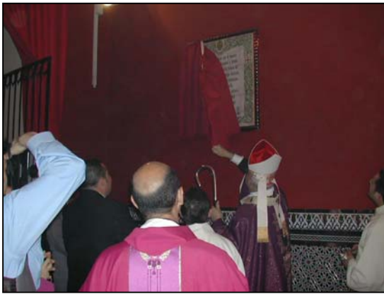
El señor Cardenal descubre la placa conmemorativa.