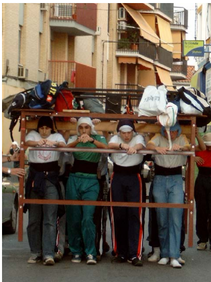
Ensayo de la Cruz de Mayo-2004