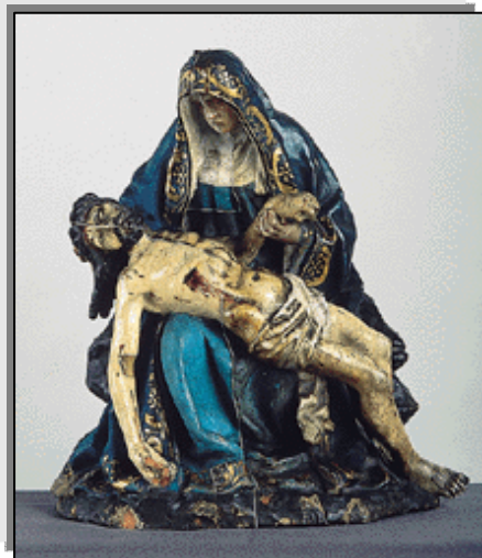
Grupo escultórico de tamaño reducido, al que se le rindió culto en los principios de la Orden Servita hispalense y que aún conserva la Hdad.

De todas estas fundaciones algunas están extinguidas en la actualidad, siguiendo la mayor parte con vida activa.