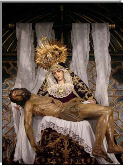
Stmo. Cristo de la Providencia y Ntra. Sra. de los Dolores de la Real Hdad. Servita de Sevilla.